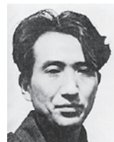
小説「津軽」の像記念館 (小泊)では、

年ならびに小説「津軽」の像建立20年を記念した特別展第2弾を開催中です。太宰治の生家津島家に関する書簡や写真は、初公開のものも多く太宰ファンならずとも必見です。