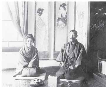
津島源右衛門・夕子(タネ)夫妻 (太宰治の両親)

日時：3月25日(木)まで 午前9時～午後4時30分(11月以降は午後4時まで) / 休館日：毎週月・火曜日、年末年始(12月28日)～1月4日(月) / 入館料：一般200円、高校・学生100円、小・中学生50円 / お問合せ：☎64-3588