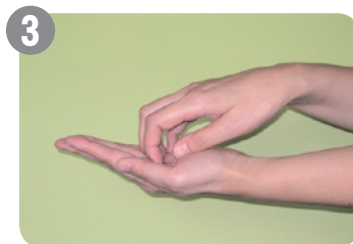
3 つめの間や指先も忘れずに洗います 特につめの間は入念に洗います