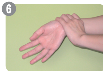
6 最後に手首を洗います。洗った らタオルで拭くのを忘れずに