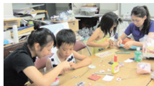
こどもたち相手に製作指導

7月から8月にかけて、博物館では中里高校1学年7名によるジョブ・シャドウ、大学生3名による博物館実習を受け入れました。前者は職場体験、後者は学芸員養成課程の一環として行われたものです。日常的な博物館の仕事体験のほか、企画立案・こども教室実践などの難題についても、若さあふれるチャレンジ精神で取り組みでもらいました。