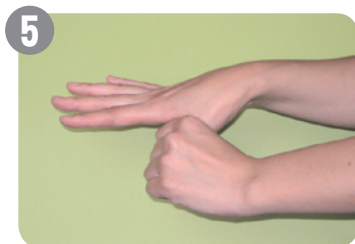
5 親指を付け根から洗います