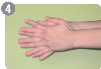
4 指の間も洗います