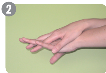
2 手の甲をこすりながら洗います