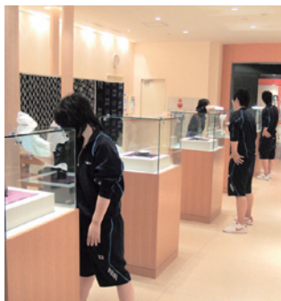
開館準備に取り組む中里高生