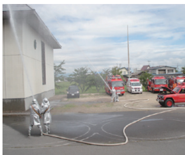
地元消防団による放水演習