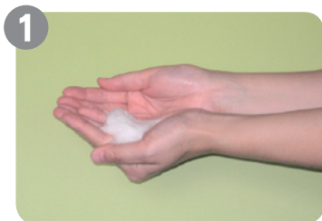
1 石けんを手のひらでこすり合わせ、泡立てます

ウイルスをきちんと洗い流すには、石けんを使って写真のように洗い流すようにしましょう。15秒以上の時間を使い、流水で洗います。洗った後は、清潔なタオルでよく拭きましょう。