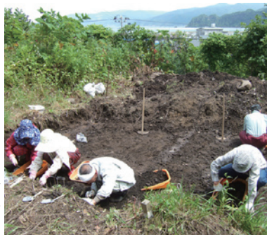
小泊港を見下ろしながらの調査