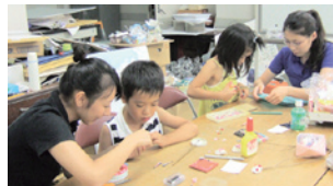
こどもたち相手に製作指導

7月から8月にかけて、博物館では中里高校1学年7名によるジョブ・シャドウ、大学生3名による博物館実習を受け入れました。前者は職場体験、後者は学芸員養成課程の一環として行われたものです。日常的な博物館の仕事体験のほか、企画展立案・こども教室実践などの難題についても、若さあふれるチャレンジ精神で取り組んでもらいました。