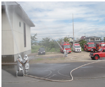
地元消防団による放水演習