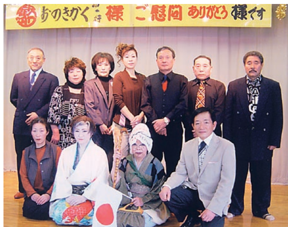
【担当 静和園 ☎57-3101】