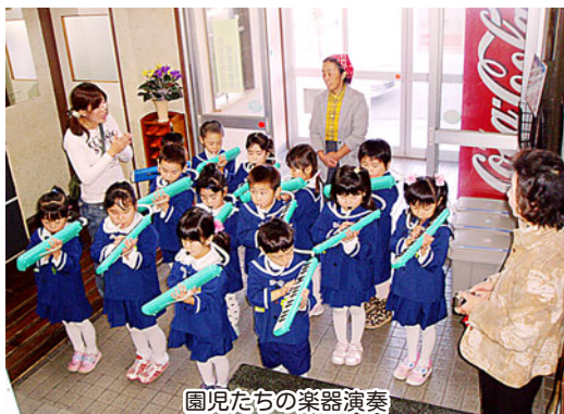
園児たちの楽器演奏

今年も綺麗なお花と、手作りカレンダーと、お餅を持って来てくれました。楽器演奏のプレゼントもあり、とても上手でした。消防署の職員は、かわいい園児達の慰問を、とても喜んでいました。(カレンダーとお花は玄関に飾っています。)