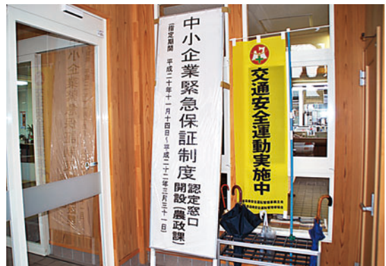
【担当 商工係 内線27】

なお、今回の見直しで指定業種も大幅に拡大され、一部規定も緩和されております。制度申込には町の認定書が必要ですので、詳しくは、担当までお問い合わせください。