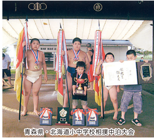
青森県・北海道小中学校相撲中泊大会