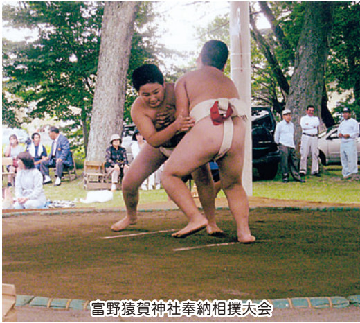
富野猿賀神社奉納相撲大会