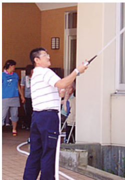
屋内消火栓による放水訓練