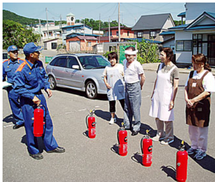
消火器による初期消火訓練

八月六日に、小泊地区 高齢者福祉センターにて、避難訓練を実施しました。センター職員はデイサービス員と協力し、入居者を安全かつ速やかに屋外へ避難させていました。その他、屋内消火栓による放水訓練、消火器による初期消火訓練も真剣に取り組んでいました。