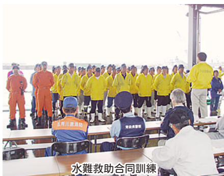
水難救助合同訓練

平成20年7月11日(金)、水難救助合同訓練が、中泊町小泊漁港内において行われました。訓練は、火災発生の船舶に対する消火訓練、乗組員救出訓練と転覆船舶からの乗組員救助訓練が行われました。小泊消防署では転覆船舶に関する訓練に参加し、行方不明の1名を消防署潜水隊員が海中捜索し救出、ゴムボートで漁港岸壁に引き揚げ待機中の救急隊へ引き継ぎ、病院へ搬送する流れで訓練を終了しました。