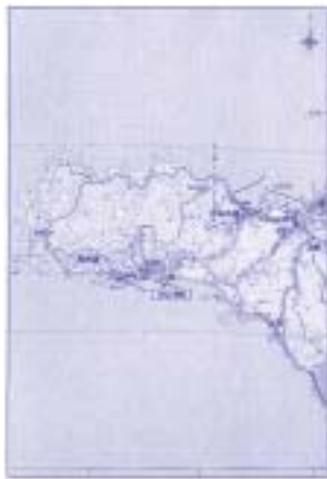
みなと団地平面図 山側