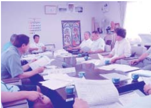
小泊地域審議会のようす