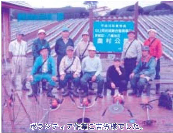
ボランティア作業ご苦労様でした。

6月5日(火)早朝、深郷田・八幡両集落の町内会の役員の皆さんが、同地区の農村公園の草刈を行いました。