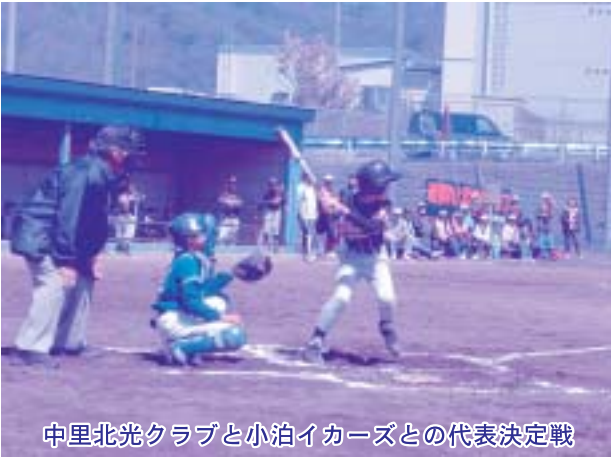
中里北光クラブと小泊イカーズとの代表決定戦

5月20日に行われた町予選会では小泊イカーズとの代表決定戦で11対1のスコアで勝ち、町の代表となりました。また、6月2日に行われた北郡予選会の一回戦で板柳北に8対0でスコアで勝ち、決勝は板柳南との対戦で12対5というスコアで圧勝し県大会出