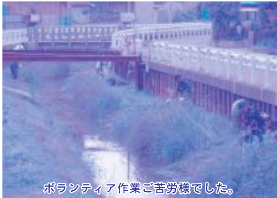
ボランティア作業ご苦労様でした。