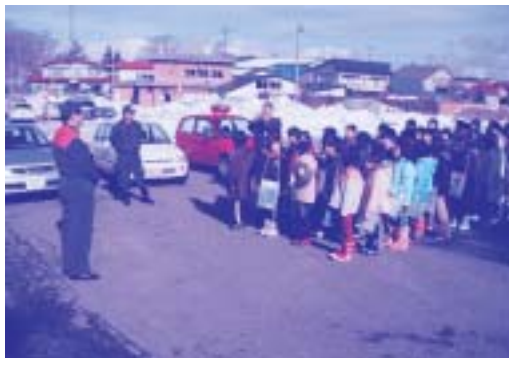
【署長の話しを聞く児童達】

児童達は、消防職員の説明を真剣に聞き、積極的に質問していました。メモ用紙には、質問したことや、職員から聞いた事をたくさん書いていて、とても熱心に勉強していました。