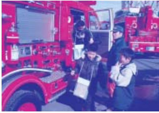
【消防車に乗ってみる児童達】