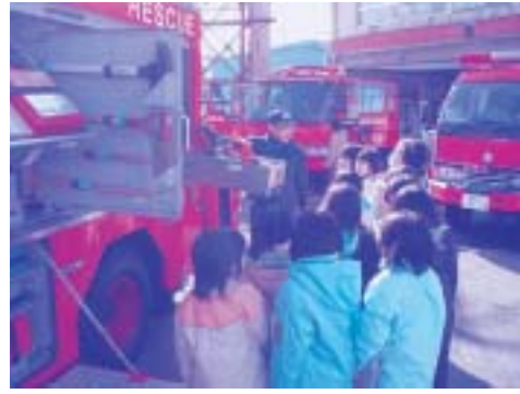
【資器材の説明を聞く児童達】