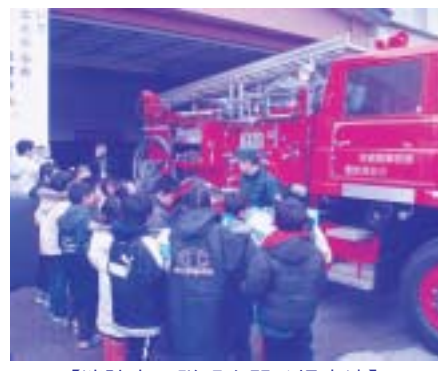
【消防車の説明を聞く児童達】

住宅用火災警報器は逃げ遅れを防ぐ為に火災による煙や熱を感知して警報を鳴らす機器で、容易に取り付けできることから、今住んでいるお住まいにも設置できます。消防署では各お住まいへの早期設置をお願いします。しかし、これに便乗する形で