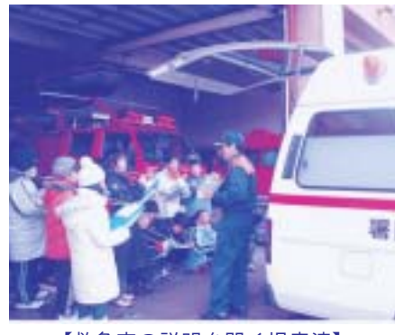
【救急車の説明を聞く児童達】

平成19年2月16日に小泊小学校の3年生45名が社会科学習として、小泊消防署に訪れました。元気な挨拶から始まり、消防署の庁舎内を見学し、消防車や