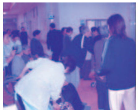
【職員に誘導され避難する入居者】

11月16日に小泊の高齢者生活福祉センターで避難訓練が行われました。ボイラー室から火災が発生した事を想定し、入居者は職員に誘導され、迅速かつ安全に避難しました。雨天ということもあり、避難訓練後は消防職員による、消火器の説明と冬季間の火の取扱いや冬道の歩行の注意などを聞いて終了しました。