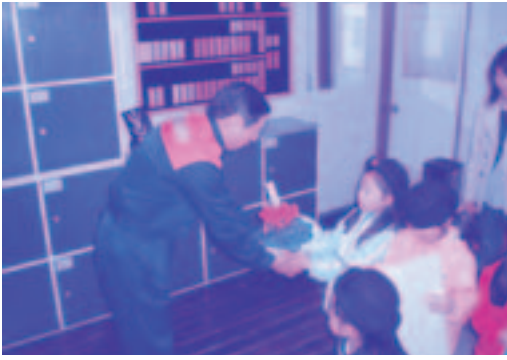
【園児から花のプレゼント】

今年も綺麗なお花と、手作りカレンダーと、お餅を持って来てくれました。楽器演奏のプレゼントもあり、とても上手でした。消防署の職員は、かわいい園児達の慰問を、とても喜んでいました。(カレンダーとお花は玄関に飾っています。)