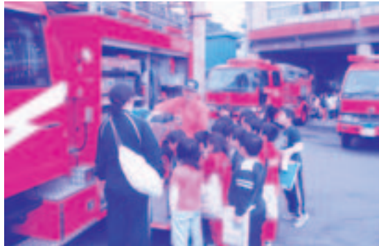
【車両資機材の説明を受ける生徒】

10月20日に、中里小学校の児童36名が、校外学習として中里消防署の見学に訪れました。消防署の職員から、火事の際に着る防火衣や車に積んでいる資機材の説明を熱心に聞いていました。実際に救急車やポンプ車に乗せてもらって車の中も見てもらったりして、児童のみなさんは、とても熱心に勉強していました。