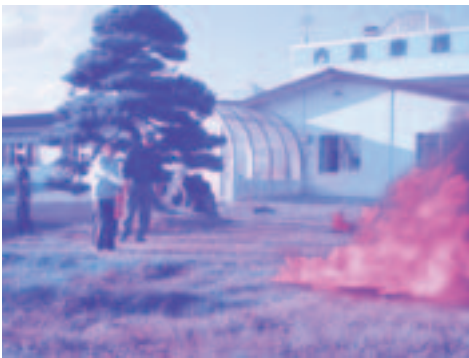
【消火器による消火訓練】

消火訓練では、消防署員から消火器の使用方法についての説明があった後、療護園職員5名に実際に消火器を使って消火訓練を行ってもらいました。また、放水訓練では屋内消火栓を使いホースを延ばし水を出して訓練をしました。