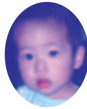
おさり ごだい 長利 冴翠 上豊岡