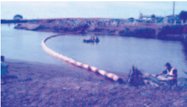
【オイルフェンス展張り訓練】

青森河川国道事務所を始め、各関係機関総勢48名が参加し、河川・排水路などに流れた油をできるだけ早く処理するための訓練を行いました。