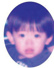
なりた しゅう 成田 集 尾別