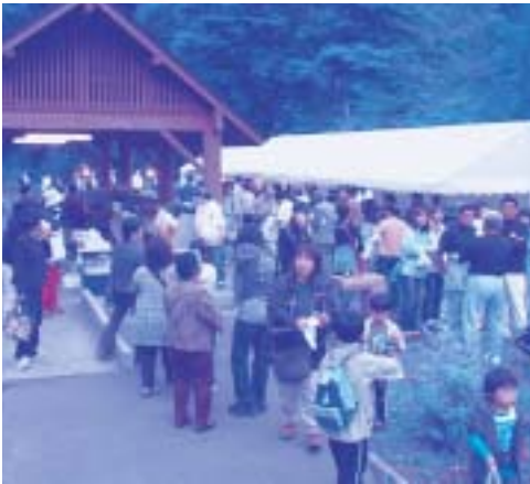
たくさんの方が訪れ、出店も大盛況

夫婦できていた青森の方に感想を伺ったところ、「ホタルが好きで、全国を回っているが、宮崎県で見たものの次にすごい。全国屈指のホタルの里ですね。すごかったです。」と興奮気味に話してくれました。