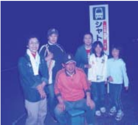
来年もまたきてね。