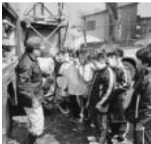
《車両や資機材の説明を聞く生徒のみなさん》

消防署では、年間を通じて防災等に関する相談に応じていますので、自分達の職場でも避難訓練を実施したい、消防計画を見直したいと考えていましたら、消防署にお問い合わせ下さい。