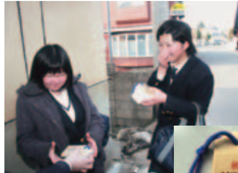
1万人目は、小泊に帰宅する中高生2人組でした

「中泊町地域連絡バス」は、合併後の中里・小泊両地域の均衡ある発展と、町民の皆さんの交通の利便性向上と交流機会の拡大を目的に運行を開始しました。小泊診療所とパルナス間の約33.4kmを所要時間約1時間で1日2往復運行しています。