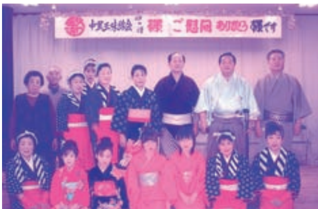
中里三味線会の皆さん