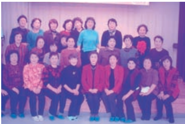
中里地区婦人会の皆さん