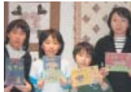
・わらじ作り(1月28日)

大の白布に、溶かした口ウで模様を描きます。染粉につけて、一煮立ち。洗って乾燥すれば完成です。