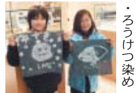
ろうけつ染め(12月27日)

大の白布に、溶かした口ウで模様を描きます。染粉につけて、一煮立ち。洗って乾燥すれば完成です。