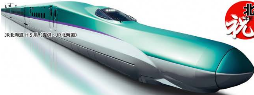
JR北海道 H5系

北海道新幹線開業2周年記念 津軽中里駅～奥津軽いまべつ駅間バス運行開始 祝 青函トンネル開業30周年記念