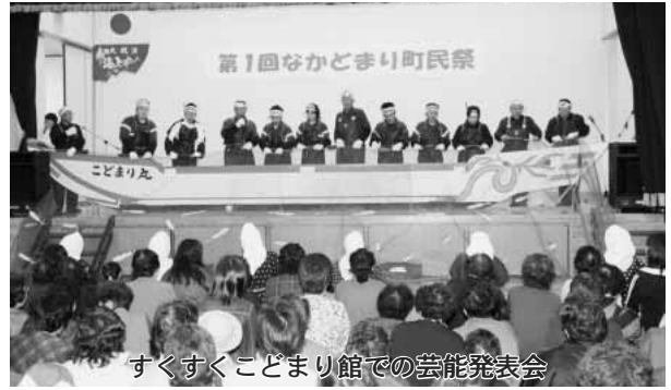
すくすくこども館での芸能発表会

10月29日、30日の2日間、日本海漁火センターとすくすくこども館を会場に開催されました。