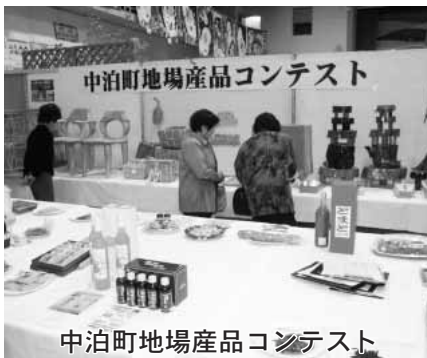
中泊町地場産品コンテスト

11月3日から5日までの3日間、体育センター・中央公民館・パルナスを主会場に行われました。3日間を通して体育センターや中央公民館には文化作品や農産物が展示されました。 3日は、体育センターで開会式が行われた後、虫歯のない子などの各表彰が行われました。また、大正琴教室や夢幻天舞のよさこいソーランなど各団体の発表が行われました。 4日は、中里・薄市・富野保育所のゆうぎや劇、中里幼稚園の楽器演奏が披露されました。 5日は、パルナスで中里中吹奏楽部のミニコンサート、各小学校の音楽発表会が行われ、午後には小泊会場と同様に両地域の芸能団体による発表会が行われました。 また中央公民館では「大地の恵と海の幸 味覚まつり」と題して、縄編み体験や小泊産を中心とした海産物の競り市、小泊産のマグロ解体ショー・試食が行われ、会場には大勢の人が詰め掛けました。