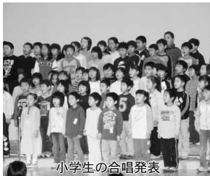
小学生の合唱発表