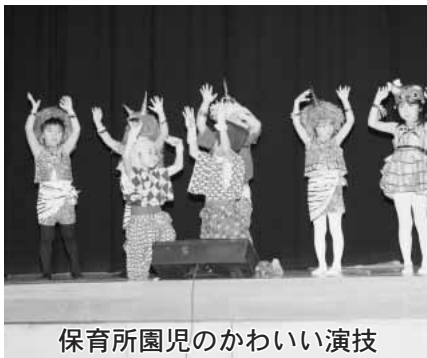
保育所園児のかわいい演技