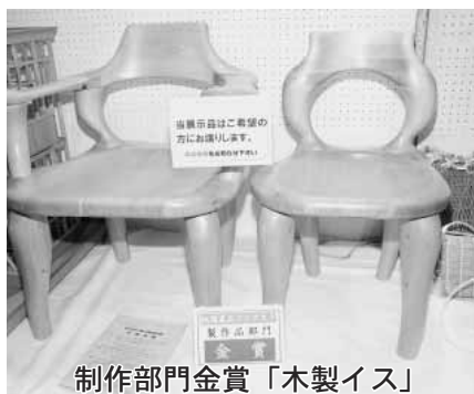
制作部門金賞「木製イス」