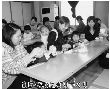
親子でおにぎりづくり