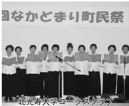
北光寿大学コーラスクラブ