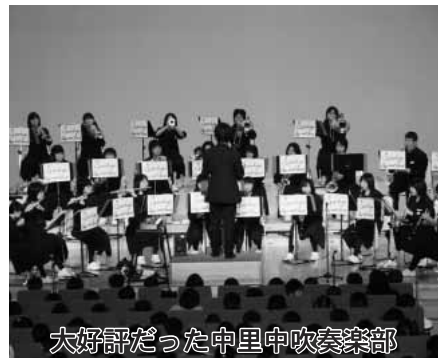
大好評だった中里中吹奏楽部