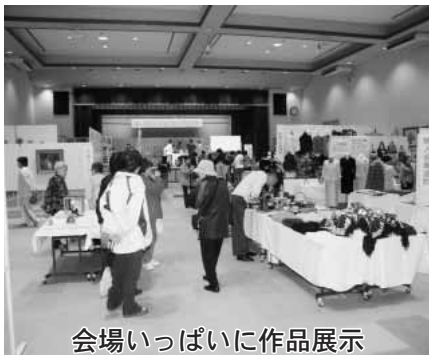
会場いっばいに作品展示