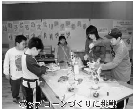
ポップコーンづくりに挑戦