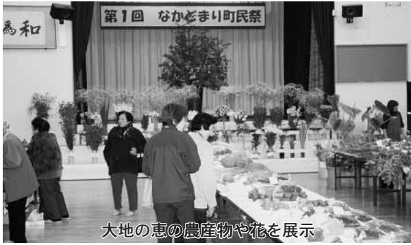
大地の恵の農産物や花を展示