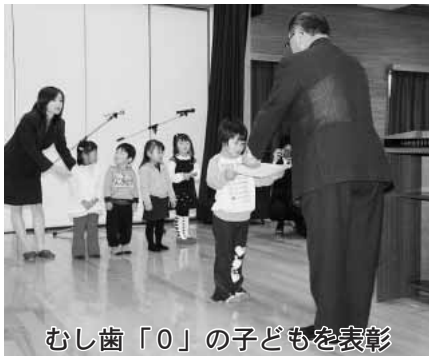
むし歯「0」の子どもを表彰

むし歯「0」本の子どもや児童・生徒の作品表彰の後には、小泊地域・中里地域各5団体に参加しての芸能発表会が行われ、多くの観衆を沸かせました。