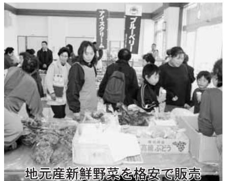
地元産新鮮野菜を格安で販売