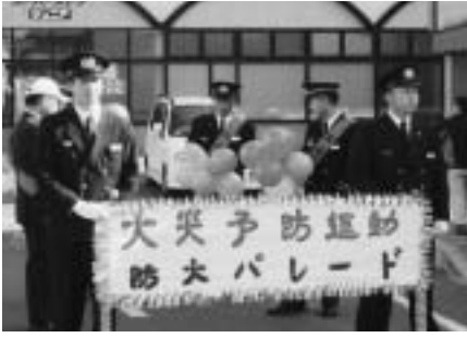
【 園児の皆さんもやる気満々！ 】

パレードは、幼稚園児らによる防火演技や演奏を行い、元氣いっぱい『火の用心』を呼びかけ、沿道に詰めかけた町民から盛大な拍手を受けていました。