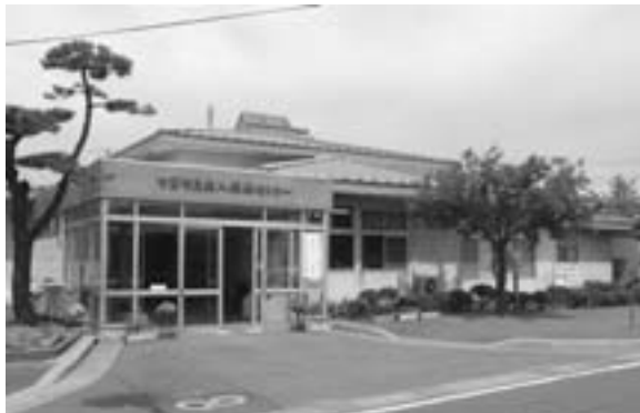
老人福祉センター 中泊町大字中里字宝森1番地2 ☎57 - 4841