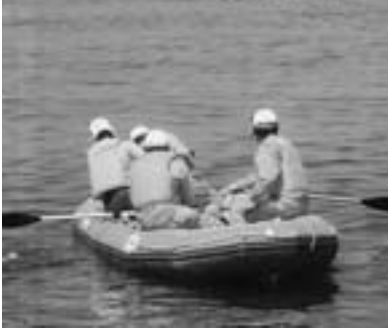
【救助ボート操船訓練の様子】