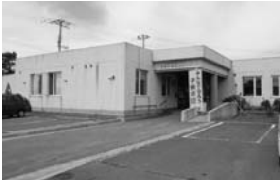
中里保健センター 中泊町大字中里字宝森1番地2 ☎57 - 3920