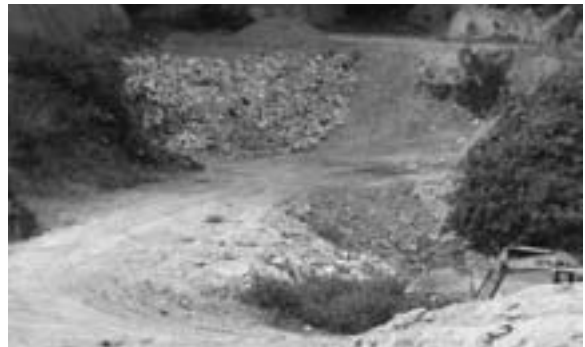
中里一般廃棄物最終処分場 中泊町大字尾別字尾別山1番地5 中泊町大字尾別字小谷291番地1 ☎57 - 4963