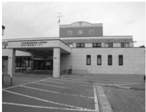
国民健康保険小泊診療所 中泊町大字小泊字朝間1番地25 ☎64 - 2117