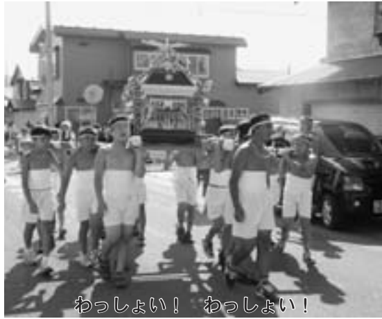
わっしょい! わっしょい!