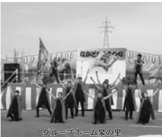
グループホーム泉の里