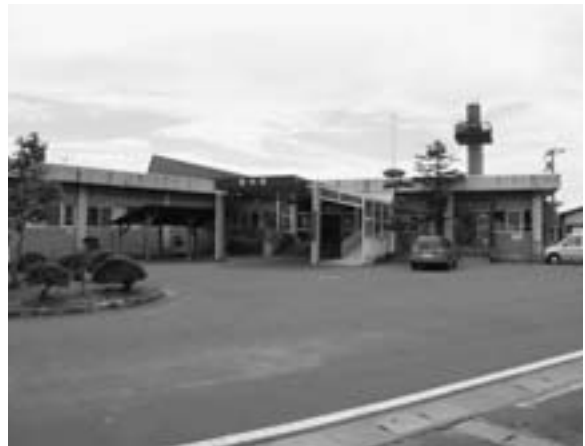
特別養護老人ホーム静和園 中泊町大字中里字宝森1番地2 ☎57 - 3101