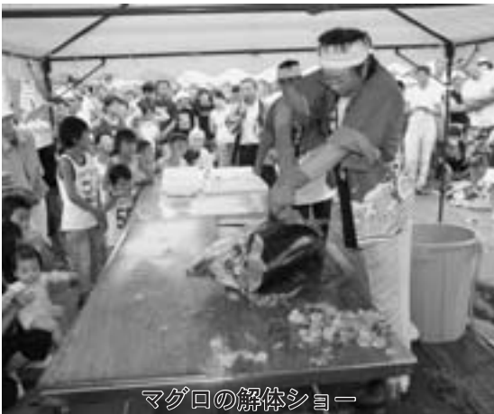
マグロの解体ショー