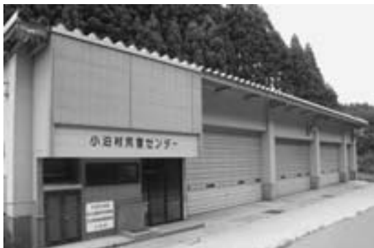
小泊克雪センター 中泊町大字小泊字築上104番地2 ☎64 - 3869