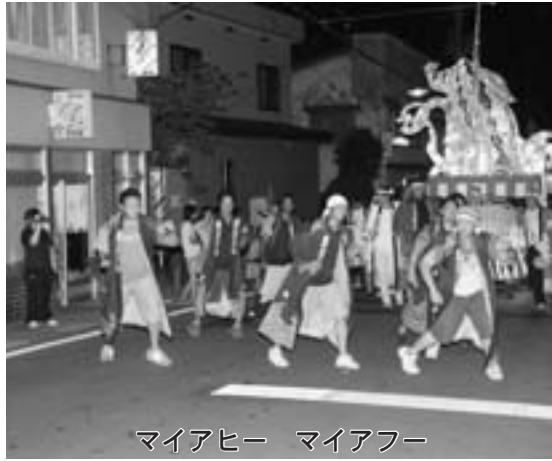
マイアヒー マイアフー