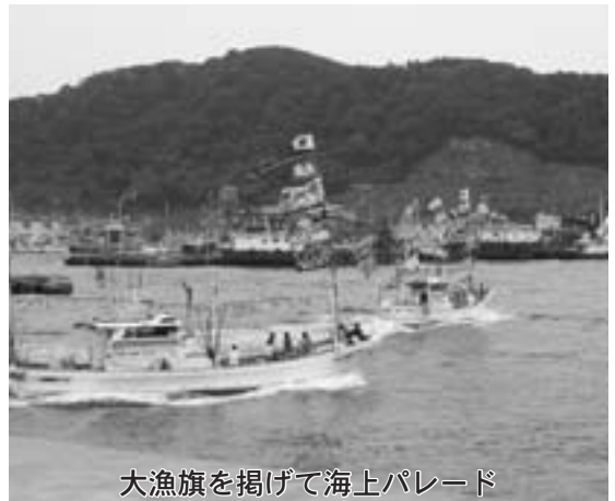
大漁旗を掲げて海上パレード