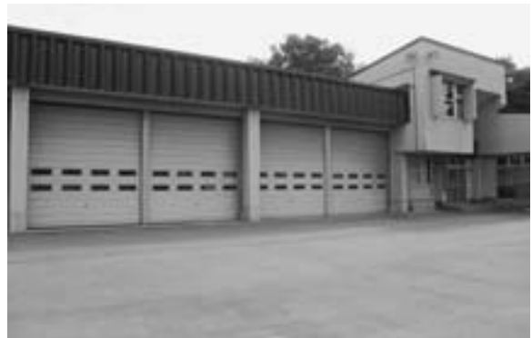
中里克雪センター 中泊町大字大沢内字二夕見356番地2 ☎57 - 2197