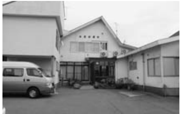
内潟診療所 中泊町大字薄市字沖原115番地32 ☎58 - 3717