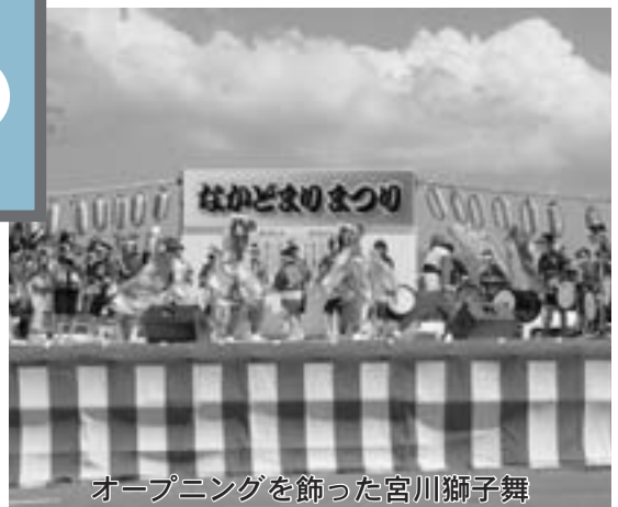
オープニングを飾った宮川獅子舞