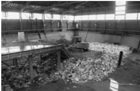
小泊一般廃棄物最終処分場 中泊町大字小泊字成滝139番地 ☎27 - 9790