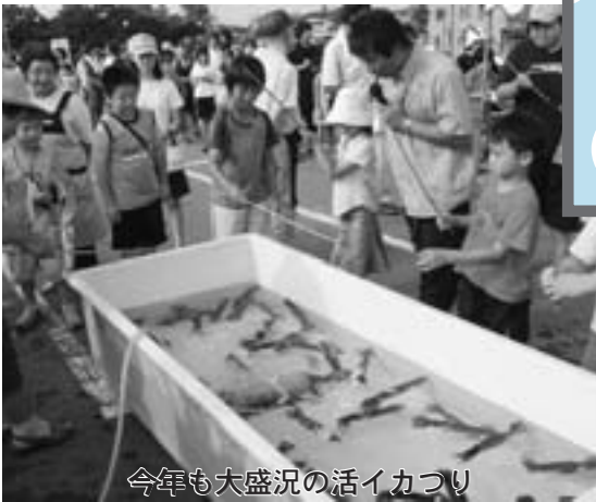
今年も大盛況の活イカ祭り