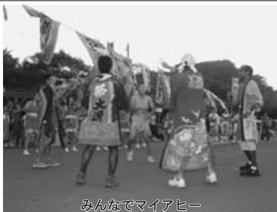
みんなでマイアヒー