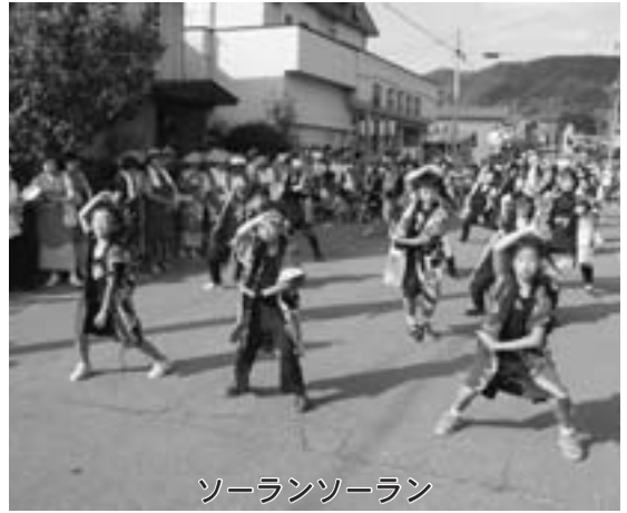
ソーランソーラン