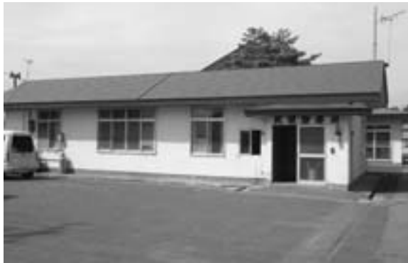
武田診療所 中泊町大字富野字千歳188番地12 ☎57 - 2134