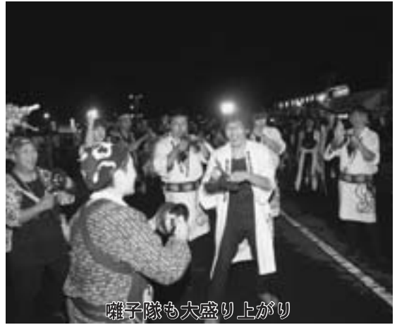
囃子隊も大盛り上がり