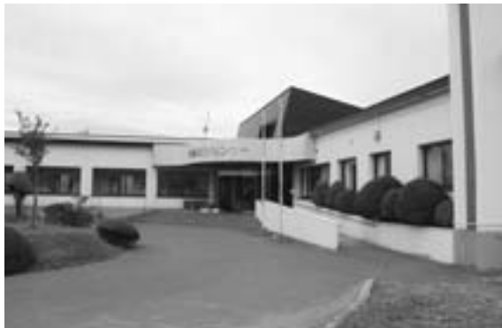
小泊保健センター 中泊町大字小泊字砂山1144番地 ☎64 - 3748