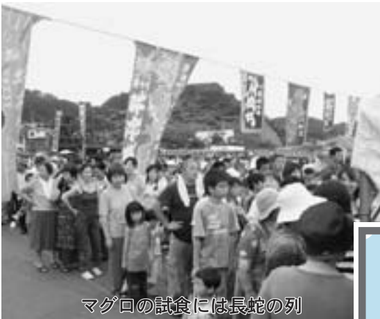
マグロの試食には長蛇の列