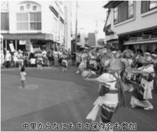
中里からなにもささ保存会も参加