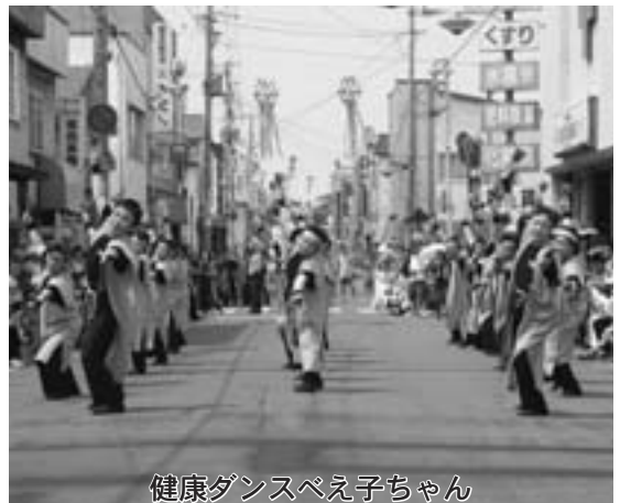
健康ダンスぺえ子ちゃん