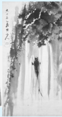
蓑虫山人画鯉魚図

放浪の画家蓑虫山人が描いた絵画や、大陸から山丹交易によってもたらされた蝦夷錦など、地域に伝わった貴重な資料をご覧ください。