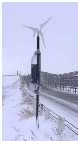
町が実証実験中の風力を使った誘導灯