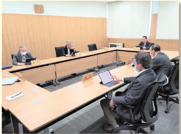
議会運営委員会の様子