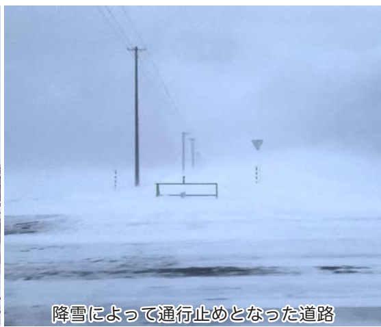
降雪によって通行止めとなった道路

できない状況となっている。町はこの路線の防雪柵設置計画だけではなく、町全体の道路の補修計画、道路側溝整備等の排水計画などを作成する必要があるとの認識のもと、令和5年度は整備計画を策定するため、県等と協議を行い、令和6年度以降に測量を実施したうえで、費用対効果等も十分考慮した計画を作成し、整備を進めたいと考えている。