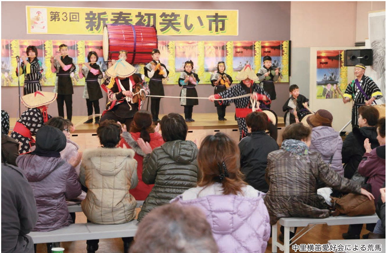
中里横笛愛好会による荒馬