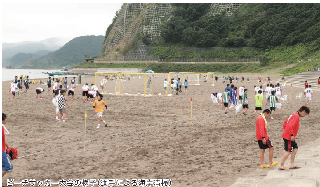
ビーチサッカー大会の様子(選手による海岸清掃)

から道の駅ポイントマリまでの道路改良の予定はないとの県の回答であるが、竜飛や竜泊ラインの観光ルートとして、また折腰内のキャンプ場やビーチサッカー大会などのアクセス道路として改良が必要な道路だと考えるのでこれについても県に要望する。