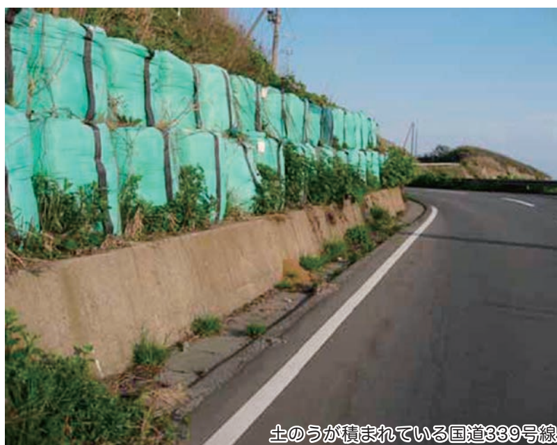
土のうが積まれている国道339号線

に地すべりの観測を実施している。今後も観測の継続と大きな変化があればすぐ対応するという県の考えである。地すべりが起きると、下前地区、小泊地区との交通が遮断されてしまい、集落の孤立という大変な事態に至ることから、今後も県に對し要望していく。