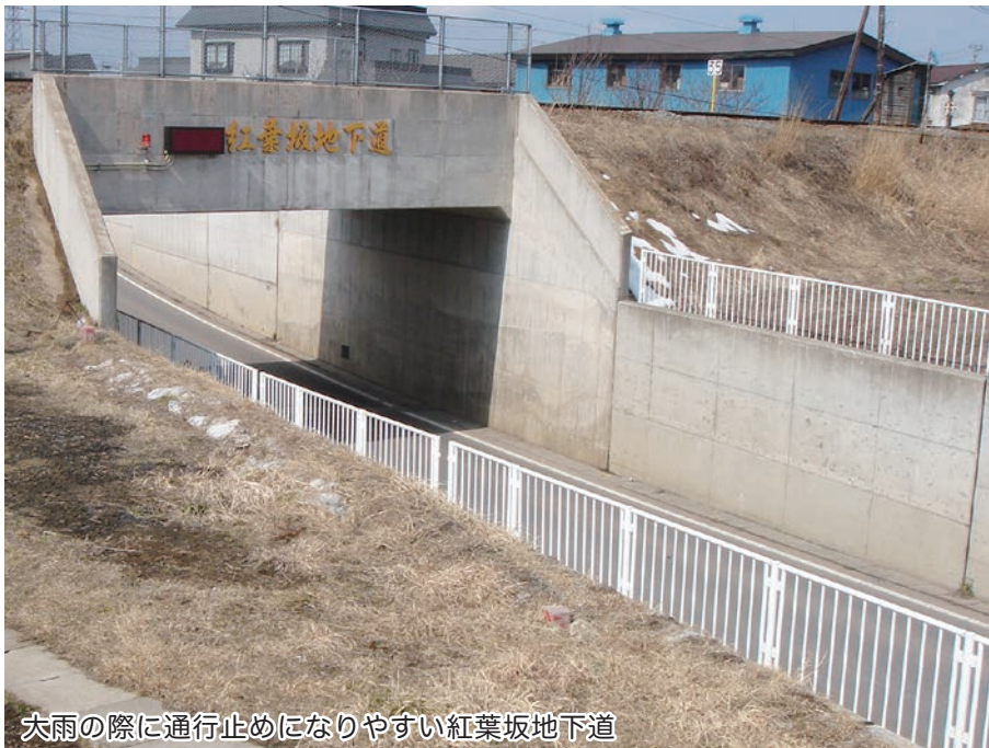
大雨の際に通行止めになりやすい紅葉坂地下道