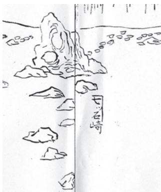
岡本三彌「海岸略図」に見る七ツ石崎・七ツ石(小泊村史所載)

結屋海湾是孰居 短蓑島外釣鯡魚 蝦夷一碧雖非迴 舟路濤高意不如 最初に紹介するのは、小泊湾の北東「七ツ石崎」の海続きにある「七ツ石」です。十二景の作者荒川秀山は、この地について「海辺に小屋を建ててあるが、これはだれの家だろうか。短い蓑を着て島外の人に鯡をとっている。蝦夷の島根は、海色みどり遠くではないが、舟路の波が