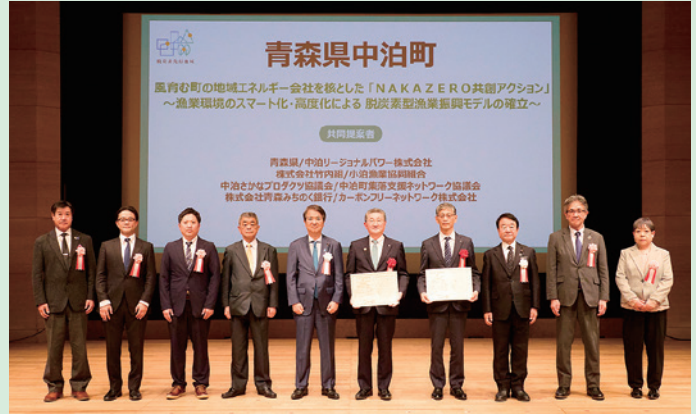
中泊町集落支援員 ネットワーク協議会 中泊リージョナルパワー株式会社 石原宏高 環境大臣 青森県 株式会社 青森みちのく銀行 カーボンフリー ネットワーク株式会社 株式会社 竹内組 中泊町 青山繁晴 環境副大臣 中泊さかな プロダクツ協議会

これらの取組は、地域の課題解決と脱炭素化を一體的に進める 再エネ裨益型地域循環モデル （下図参照）として評価されました。