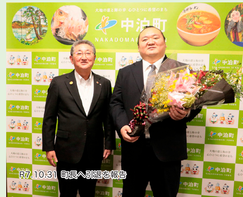
R7.10.31 町長へ引退を報告