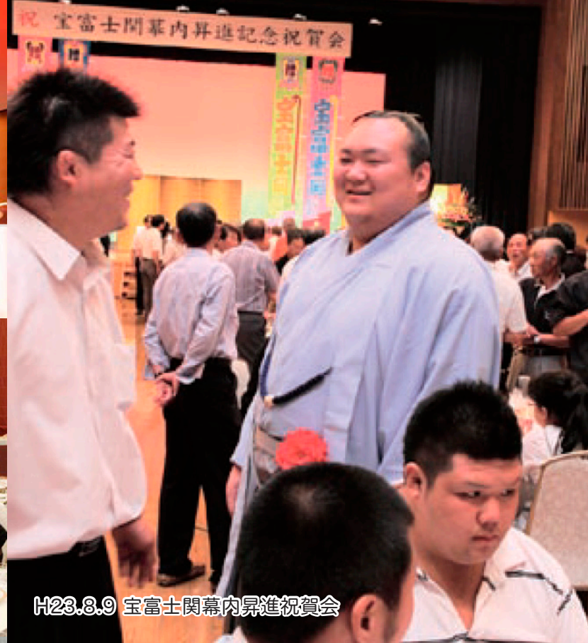
H23.8.9 宝富士関幕内昇進祝賀会