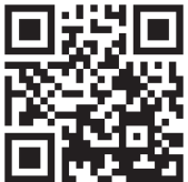
キャンペーン公式サイト

《新企画「あおたびWチャンス」》 キャンペーン参加宿泊施設のうち、Wチャンス対象の宿に泊まると抽選でペア宿泊券などの素敵なプレゼントが当たります。応募条件など詳しくはキャンペーン公式サイトをチェック！ https://fuyuno-aotabi.jp/