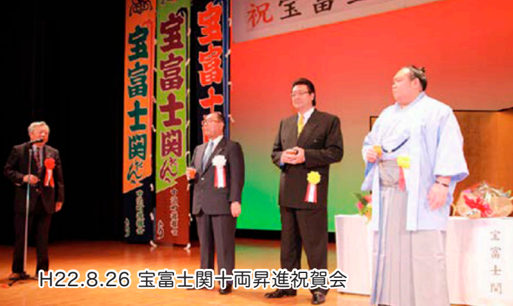
H22.8.26 宝富士関十両昇進祝賀会