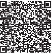
QRコード (町保育施設)

※右のQRコードから保育施設のページへアクセスできます。 くわしい案内は町ホームページ( https://www.town.nakadomari.lg.jp )をご覧ください