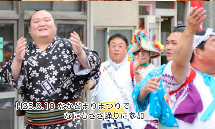
H25.8.10 なかどまりまつりで なにもささ踊りに参加