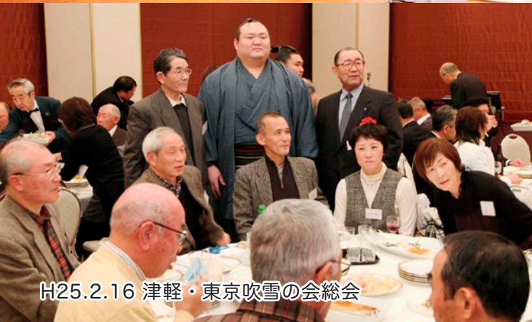
H25.2.16 津軽・東京吹雪の会総会