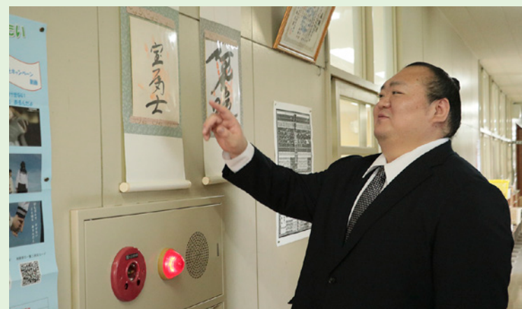
R7.10.31 引退報告後に母校である中里中学校を訪れ、 初期のサインの出来栄を恥ずかしがる様子

三段目優勝 1回 敢闘賞 1回(その場所で好成績を残した力士に贈られる賞) 金星 3回(前頭が横綱と取組をして勝利すること) 生涯戦歴 678勝720敗(99場所) 幕内戦歴 544勝626敗(78場所)