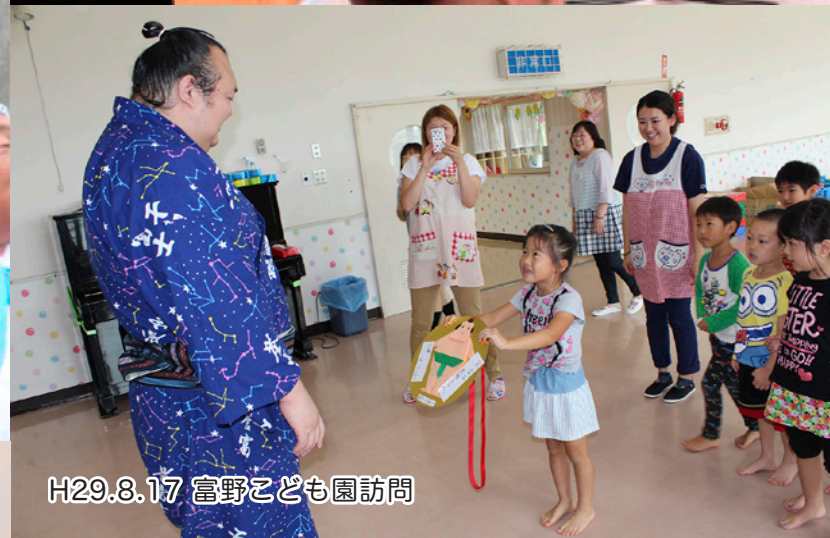
H29.8.17 富野こども園訪問