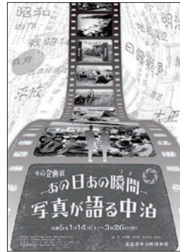
◆冬の企画展「あの日あの瞬間」 写真が語る中泊」開催！

明治く平成にかけて撮影された 中泊の風景・人物を通して、近現 代の中泊を振り返ります。 日時：1月14日(土)～3月26日(日)・ 午前9時～午後4時45分／休館日 ：毎週月曜・第4木曜・祝日／入 館料：通常料金(一般200円、高 校・学生100円、小・中学生50円)