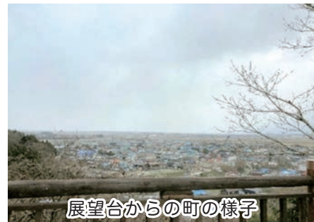
展望台からの町の様子