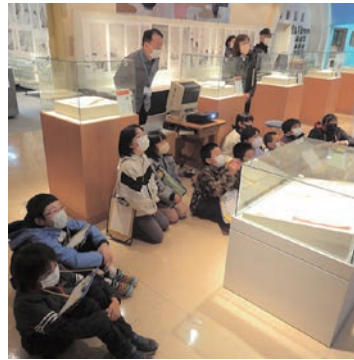
◆武田小校外学習／ このほど武田小3・4年生が、

明治く平成にかけて撮影された 中泊の風景・人物を通して、近現 代の中泊を振り返ります。 日時：1月14日(土)～3月26日(日)・ 午前9時～午後4時45分／休館日 ：毎週月曜・第4木曜・祝日／入 館料：通常料金(一般200円、高 校・学生100円、小・中学生50円)