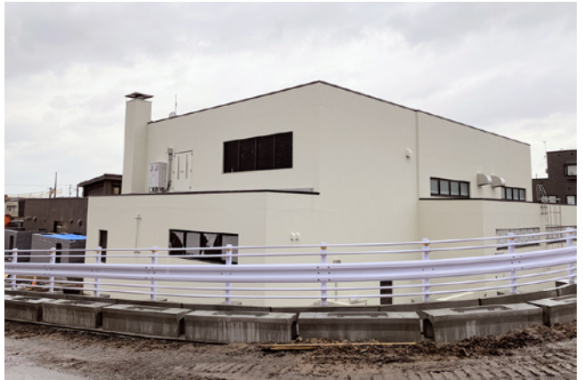
※左は派立商店街通り沿い方向から、右は町防災倉庫沿い方向からの写真（11月28日現在）