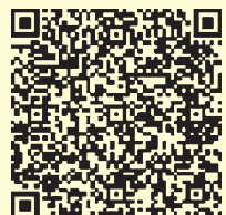
↑町ホームページQRコード

・1乗降あたり 200円 ※小学生以下無料 ・フリー乗降可能 ・1日4便 ・365日運行 ※くわしくは広報4月号同時配布のチラシまたは町ホームページをご覧ください。