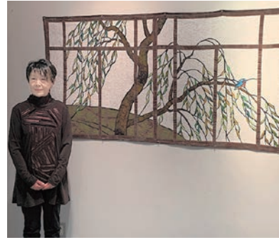
「水辺の風景」と製作者の秋田景子氏

日時：7月2日(日)まで 午前9時～午後4時45分／休館日：毎週月曜・祝日・第4木曜日／入館料：…通常料金(一般200円、高校・学生100円、小・中学生50円)