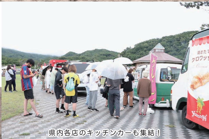
県内各店のキッチンカーも集結！