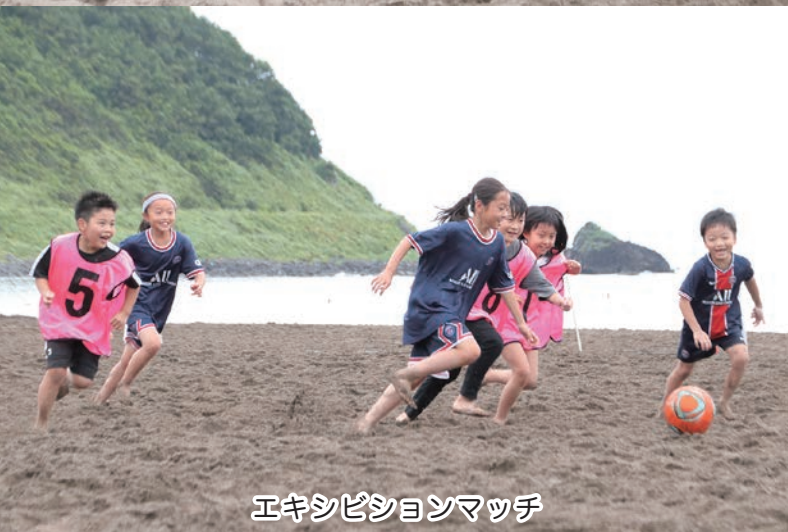
エキシビジョンマッチ