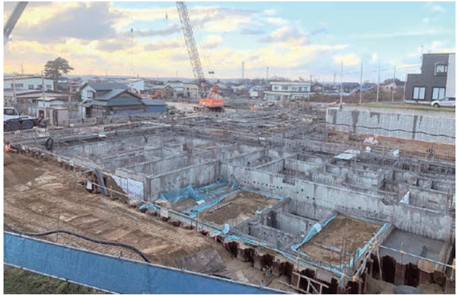
※左は派立商店街通り沿い方向から、右は町防災倉庫沿い方向からの写真(11月24日現在)