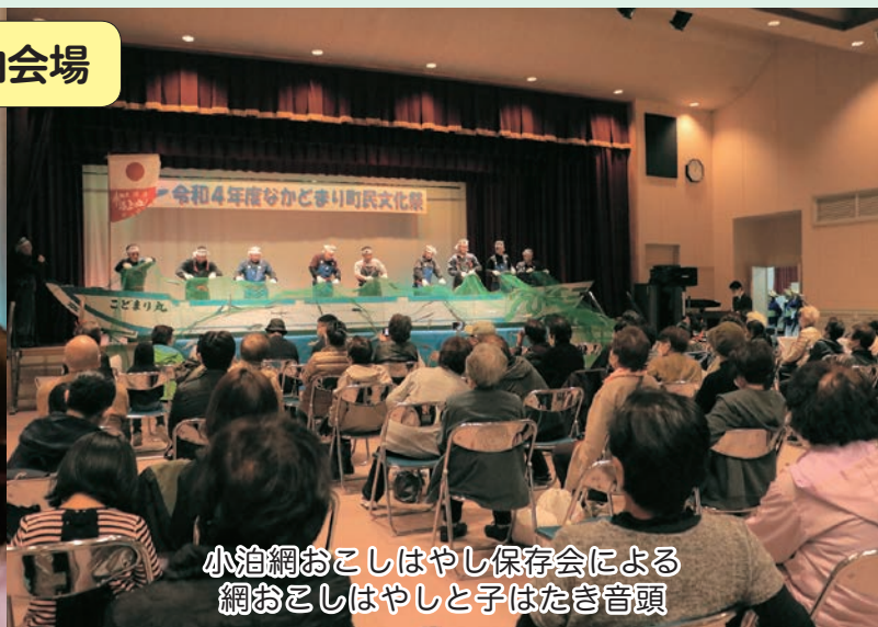
小泊網おこしはやし保存会による 網おこしはやしと子はたき音頭