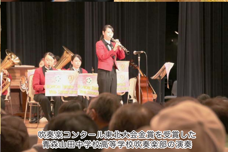
吹奏楽コンクール東北大会金賞を受賞した 青森山田中学校高等学校吹奏楽部の演奏