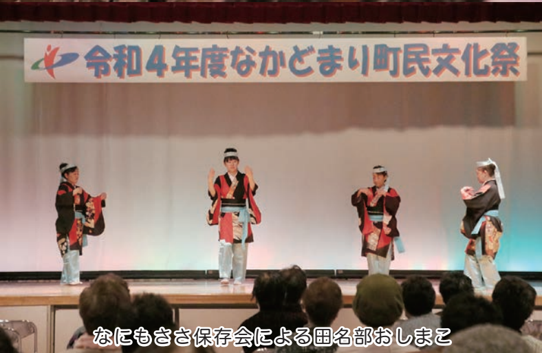
なにもささ保存会による田名部おしまこ