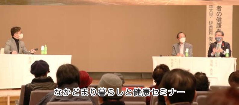
なかどまり暮らしと健康セミナー