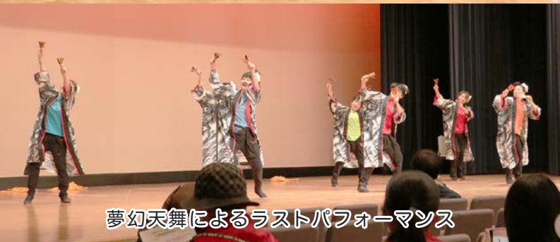
夢幻天舞によるラストパフォーマンス