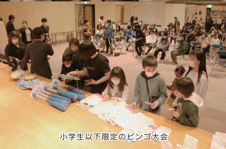
小学生以下限定のビンゴ大会