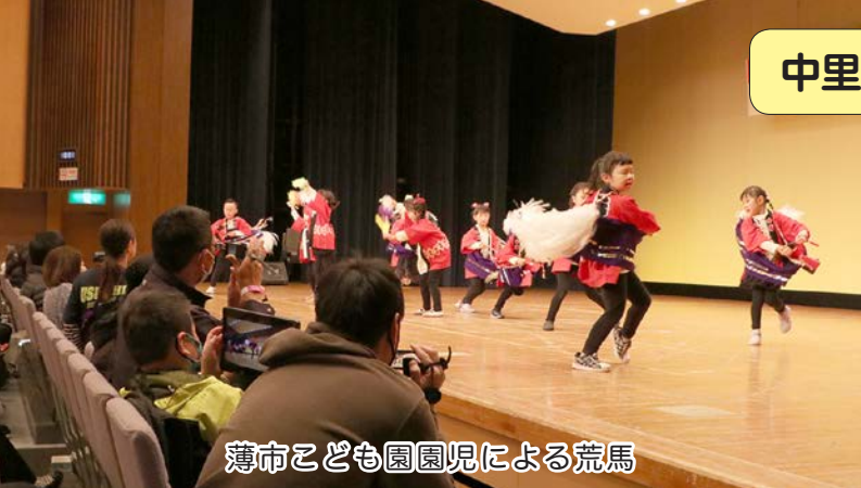
薄市こども園園児による荒馬