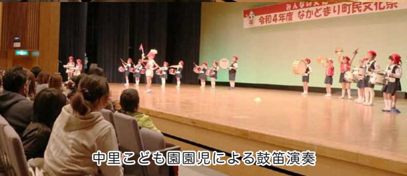
中里こども園園児による鼓笛演奏