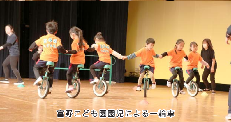
富野こども園園児による一輪車