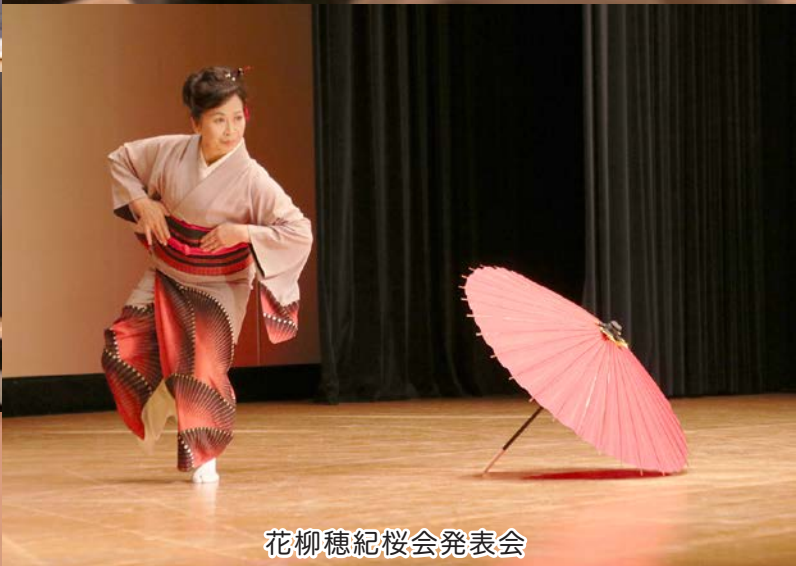
花柳穂紀桜会発表会