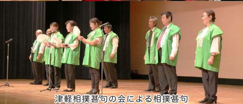
津軽相撲甚句の会による相撲甚句