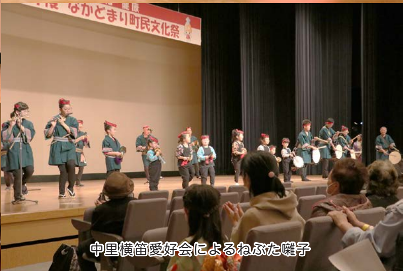
中里横笛愛好会によるねぶた囃子