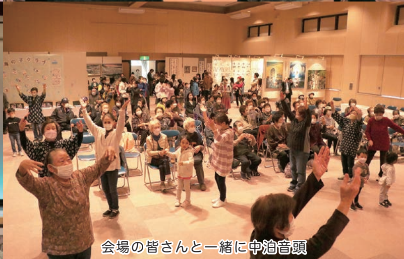
会場の皆さんと一緒に中泊音頭