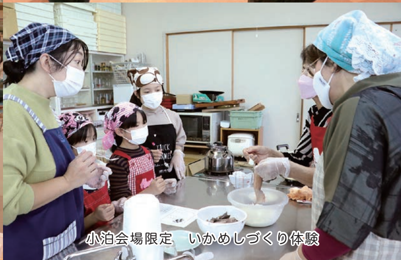
小泊会場限定 いかめしづくり体験