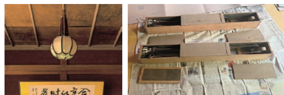
詩夢庵照明 木箱の中身

◆宮越家離れの謎の箱とは!? このほど、宮越家離れ「詩夢庵」の天井裏から、奇妙なものが発見されました。それは、20センチ四方×長さ150センチほどの木箱2点です。 鉤の付いた棒でたぐり寄せ、天井裏から降ろすことに成功。掛軸の収納箱にも見えましたが、スライド式の蓋を開けると、中にはバナナ状のコイルと電気コードが巻き付いた滑車が収められていました。 どうやら、照明の高さを変更するための伸縮自在ケーブルのようです。期待した掛軸は見つかりませんが、大正時代の仕掛けに驚かされた一日となりました。