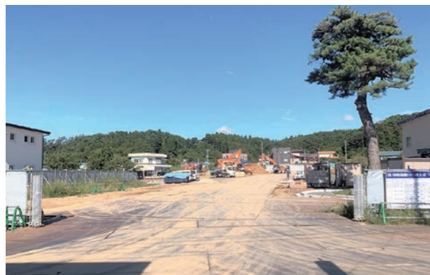
派立商店街通り沿い方向から