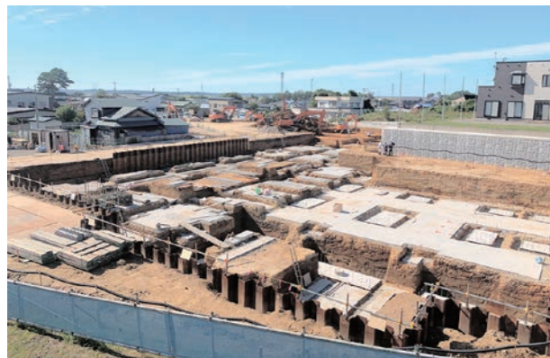
町防災倉庫沿い方向から

9月はメインとなる温泉施設建設のための掘削工事が始まりました。外構工事では施設内歩道の路盤工事を行っています。