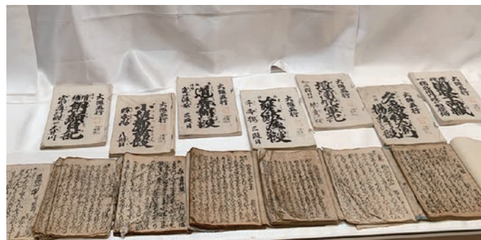
上段が明治期の「抜き本」、下段が江戸中期の「通し本」

◆企画展「ヤマシチ宮越家のものがたり」開催中! 【TEL 69-1111】 Museum News VOL.133