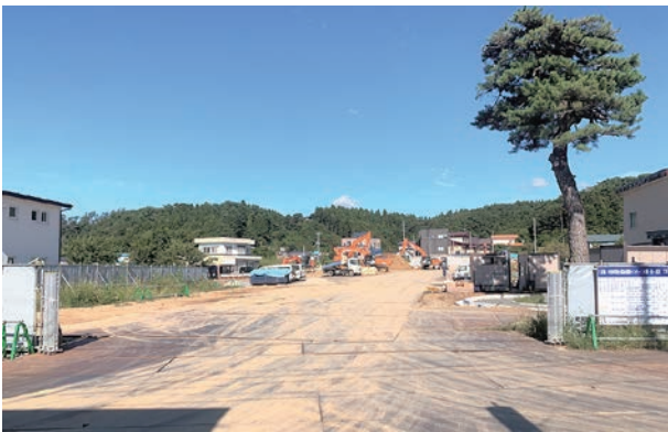
派立商店街通り沿い方向から