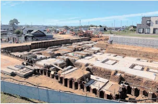
町防災倉庫沿い方向から

9月はメインとなる温泉施設建設のための掘削工事が始まりました。外構工事では施設内歩道の路盤工事を行っています。