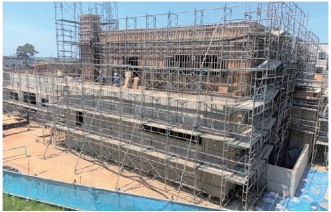
※左は派立商店街通り沿い方向から、右は町防災倉庫沿い方向からの写真（5月25日現在）