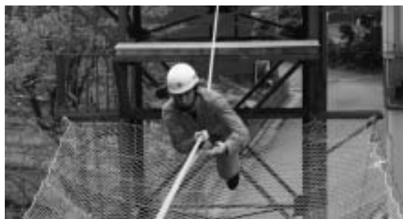
【ロープブリッジ渡過】

6月29日に行われる消防救助技術青森県大会に向けて、中泊町から中里消防署10名、小泊消防署5名の計15名の編成で訓練を開始しました。昨年は中里消防署から1名の隊員が宮城県仙台市で行われた東北大会に出場しました。今年は全隊員が行けるように頑張っています。