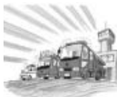
◎火災時はタンク車