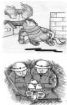
金木、市浦地区の現場へ