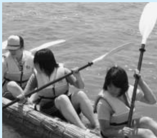
ヨシ(アシガヤ)船で岩木川クルーズ