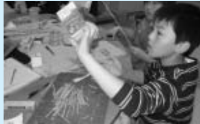
アシガヤを利用したクラフトワーク

6月より博物館・図書館において地域こども教室が始まりました。同事業は、放課後や休校日のこどもたちを対象とした居場所づくり事業の一環として行われ、来年の2月まで休館日を除いたほぼ毎日開催されます。