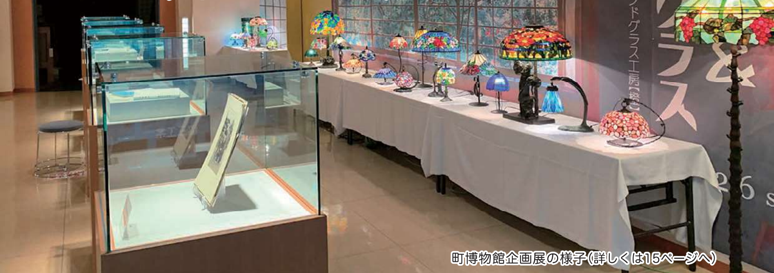
町博物館企画展の様子(詳しくは15ページへ)