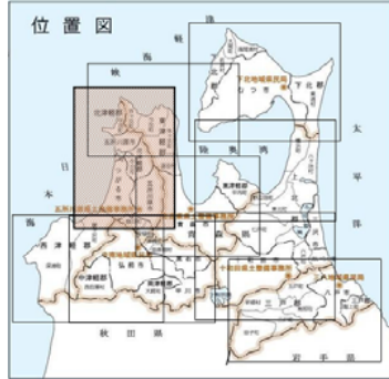
西北地域県民局地域整備部管内図 その1